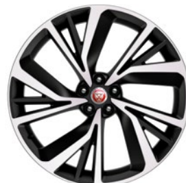
22" KOLA S 5 DVOJ. PAPRSKY DIAMOND TURNED (STYLE 5056)