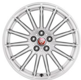
18" KOLA S 15 PAPRSKY (STYLE 1022) Standardní výbava pro I-PACE S