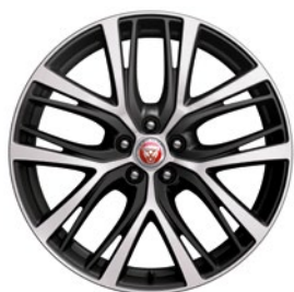
20" KOLA S 5 DVOJ. PAPRSKY TECHNICAL GREY, DIAMOND TURNED (STYLE 5070)