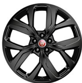
20" KOLA S 5 PAPRSKY GLOSS BLACK (STYLE 5068)