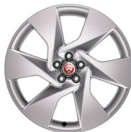
20" KOLA S 6 PAPRSKY (STYLE 6007) Standardní výbava pro I-PACE SE