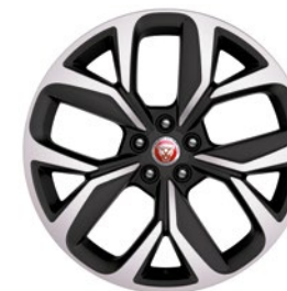
20" KOLA S 5 PAPRSKY DIAMOND TURNED (STYLE 5068) Standardní výbava pro I-PACE HSE