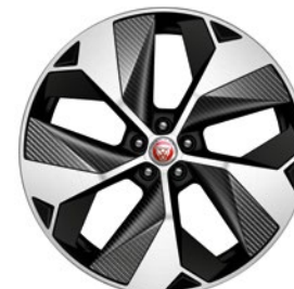
22" KOLA S 5 PAPRSKY GLOSS BLACK, DIAMOND TURNED, S PRVKY Z UHLÍKOVÉHO KOMOZITU (STYLE 5069)