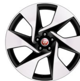
20" KOLA S 6 PAPRSKY DIAMOND TURNED (STYLE 6007)