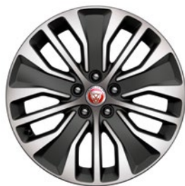
18" KOLA S 5 DVOJ. PAPRSKY DIAMOND TURNED (STYLE 5055)