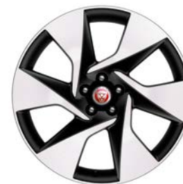
20" KOLA S 6 PAPRSKY GLOSS DARK GREY CONTRAST DIAMOND TURNED (STYLE 6007)