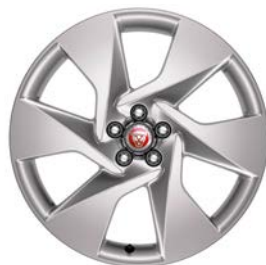
20" KOLA S 6 PAPRSKY GLOSS SPARKLE SILVER (STYLE 6007)